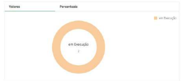
Situação dos Instrumentos Assinados - Agrupada

Instrumentos Assinados: 2 % Assinatura de Instrumentos: 100,00%